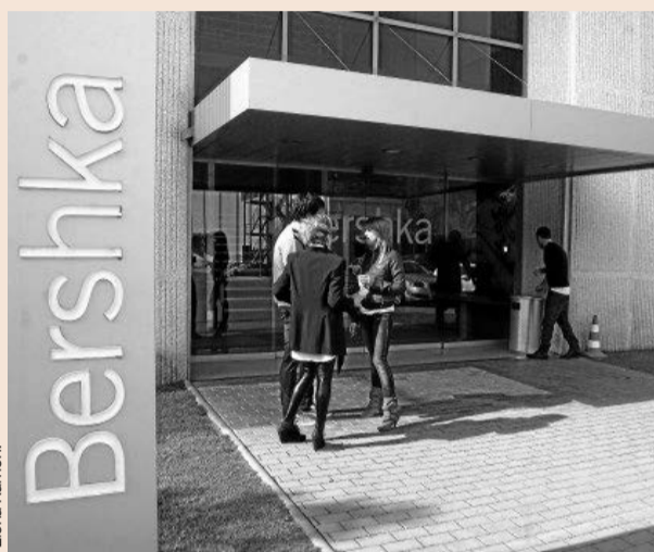
Sede de Bershka en Tordera.

nos terrenos, como uno situado cerca de Sant Andreu. En cualquier caso, busca unas instalaciones de grandes dimensiones, ya que además de las oficinas para las 400 personas, se necesita espacio para instalar los talleres de patronaje, donde se confeccionan las prendas originales, los platós de fotografía, la tienda piloto que siempre se ubica en el interior de la sede de cada cadena y otros espacios como salas de reuniones o servicios comunes para el personal. El objetivo es atraer y retener a los mejores profesionales. P3