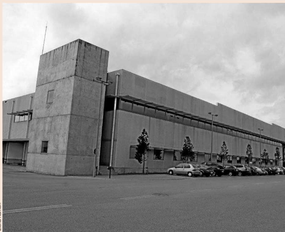
La sede corporativa de Bershka en Tordera (Maresme).

Bershka es la segunda cadena de Inditex, superada sólo por Zara. En 2015, esta marca fue una de las que experimentó un mayor crecimiento dentro del grupo, un 12,7%, y alcanzó una facturación de 1.875 millones de euros. El resultado de explotación también registró un importante incremento, del 22%, hasta los 299 millones.