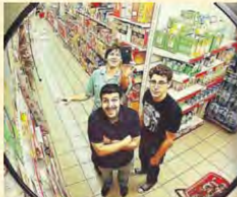
Els membres de Primitive Films tenen entre mans un documental, una pel·lícula de ficció i aplicacions. PRIMITIVE FILMS

Tenen diversos projectes entre mans, des d'un documental fins a