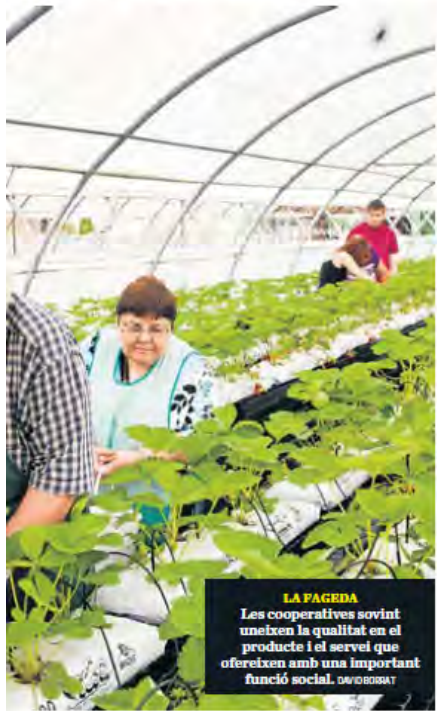
LA FAGEDA Les cooperatives sovint uneixen la qualitat en el producte i el servei que ofereixen amb una important funció social. DAVID ROSSET