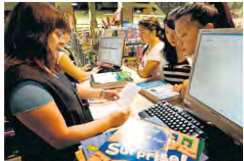
Abacus és una de les cooperatives més importants de Catalunya i té un total de 37 establiments. DAVID ROSSET

una pel·lícula de ficció, passant per aplicacions multimèdia per a mòbils i xarxes socials. A part del cooperativisme, també destaquen l'èxit que han tingut amb el crowdfunding , gràcies al qual asseguren que han pogut créixer en el món audiovisual. Gràcies a aquest sistema de finançament per micronegociacions estan finançant el seu primer documental.